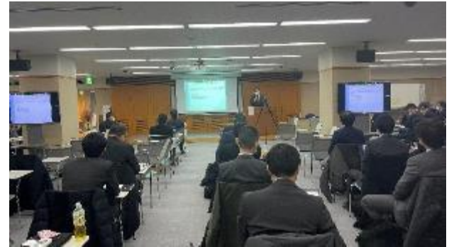
研究報告会の様子 (令和5年1月30日)